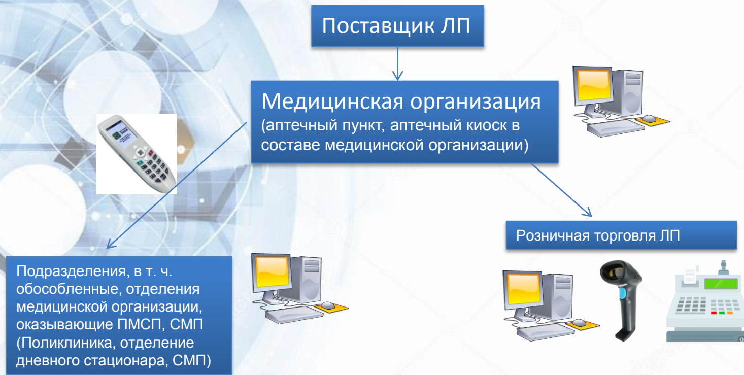
Схема работы медицинских организаций в ФГИС «МДЛП»